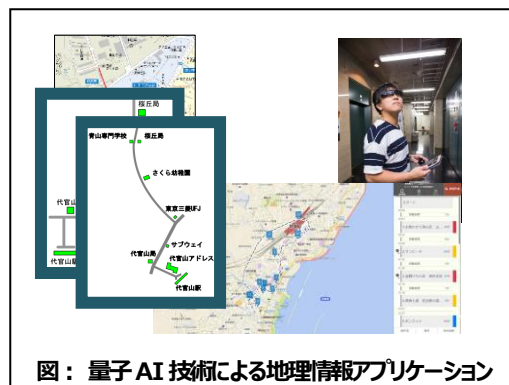
図：量子AI技術による地理情報アプリケーション