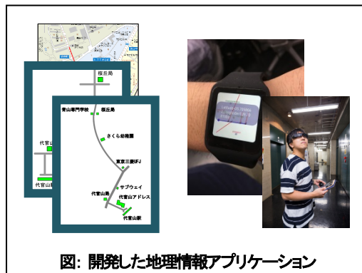
図: 開発した地理情報アプリケーション

上記に加え、IoTによる通信処理・暗号処理など広くサービスを想定し、ハードウェアとソフトウェアから構成される【 具体的なシステムの設計 】に取り組んでいます。